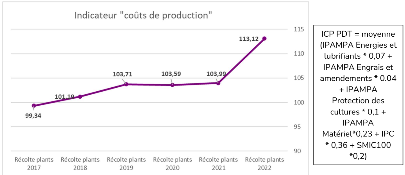
Indicateur 1 : « Coûts de production de semence »

Graphique retraçant l'évolution de l'indicateur lié aux coûts de production sur 5 ans de la récolte de plants 2017 à la récolte de plants 2022. Les indicateurs sont égaux à la moyenne des indices mensuels de juillet de l'année N-1 à juin de l'année N (en cours) pondérés selon la formule ci-dessous (issue d'une étude menée par l'ITA FN3PT) :