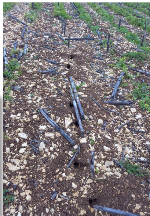
Dégâts de campagnols sur parcelles de semences de graminée (à gauche) et persil (à droite)

Longévité : 1 à 3,5 mois selon la saison de naissance.