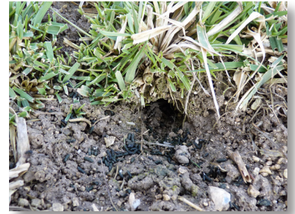
Des végétaux fraîchement coupés, des couloirs de circulation lissés, des fèces en sortie de terriers constituent les indices les plus évidents de présence active.

Exemple : sur une parcelle comprenant 10 tronçons positifs sur 58, la densité de population est estimée à 17%.