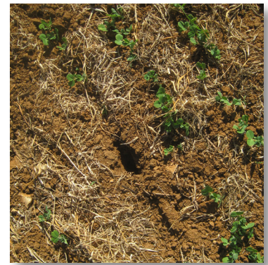
Terrier dans parcelle de pois potager

A noter que l'arrêté interministériel ouvre la possibilité de signature d'un contrat de lutte pluriannuel entre la FREDON/FGDON et l'agriculteur. Dans ce cas, le seuil d'intervention pour la lutte chimique est relevé par dérogation à 50% d'indice de présence (au lieu de 33%), ce qui donne un peu plus de souplesse dans la lutte raisonnée. Ces nouvelles dispositions sont mises en place progressivement dans les régions.