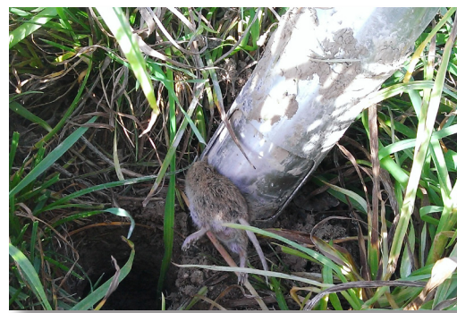
Capture de campagnol par piégeage (modèle Topcat)

NB : la distribution d'appâts à base de bromadiolone n'est à ce jour pas encore possible dans toutes les régions (se renseigner auprès de votre FREDON ; voir contacts page suivante). Dans tous les cas, informez rapidement votre FREDON de la présence active de campagnols dans vos cultures pour que les plans de lutte se mettent en place dès que possible.